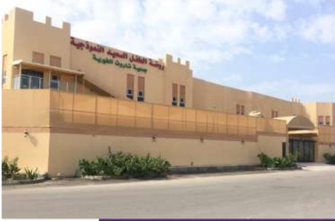
روضة تاروت النموذجية