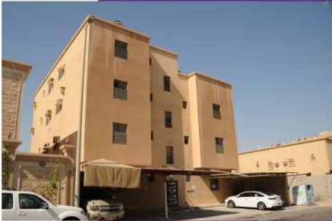
مبنى التكافل الاجتماعي ( عقار مؤجر )