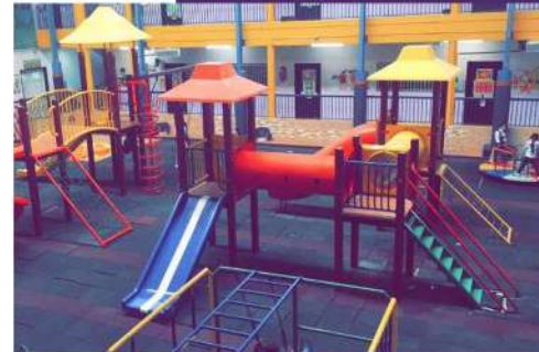
مبنى الروضة القديم