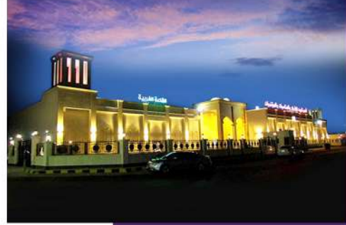
مجمع صالات الأفراح