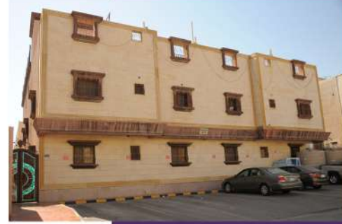
مبنى كافلا ( عقار مؤجر )